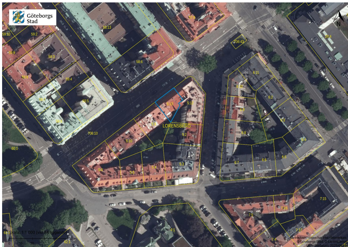
Figur 4: Ortofoto med planområdet markerat med blått.

Planområdet är sedan tidigare bebyggt enligt gällande detaljplan (tidigare benämnd stadsplan).